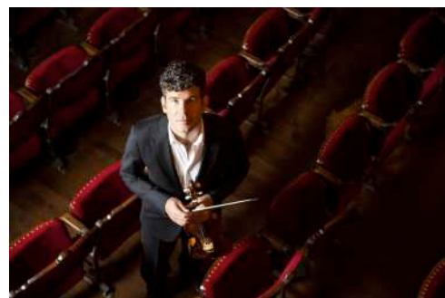
Johannes Pramsohler