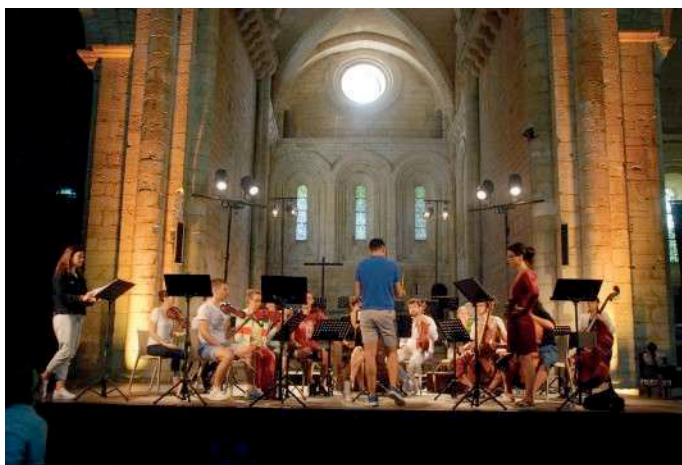
Répétitions Académie baroque internationale 2021

Au village de Saint-Amand-de-Coly (Dordogne)