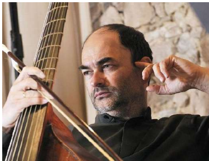
Cristophe Coin

ANDRÉ CAMPRA Enée et Didon, cantate mise en concert JOSEPH BODIN DE BOISMORTIER Pleurez mes tristes yeux Lorsque je bois Laissons là dormir Grégoire JEAN-PHILIPPE RAMEAU Les Surprises de l'Amour - Anacréon