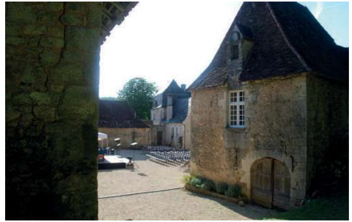
Les Fraux 2021, Espace