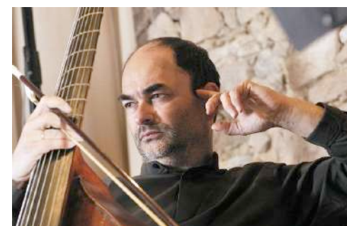
Christophe Coin