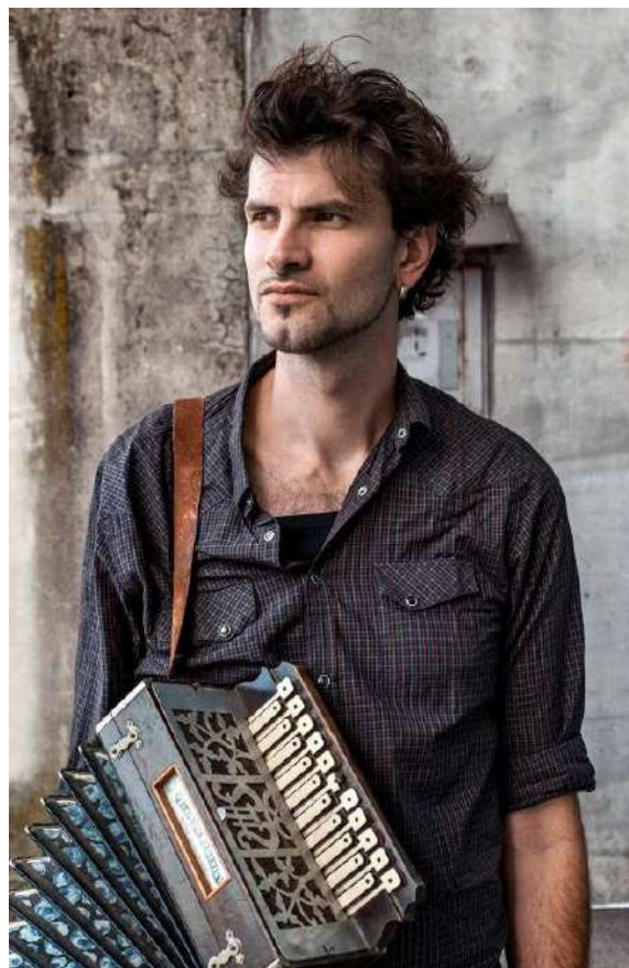
Vincent Peirani

Couronné par la critique (Diapason d'or de l'année, Choc du Monde et Choc de Classica...), François Salque est une référence dans le monde du violoncelle. Artiste classique, il met cependant un point d'honneur à croiser les genres et explore depuis plusieurs années les frontières entre musiques écrites et improvisées, entre répertoires savants et vivants. Le duo qu'il forme avec l'accordéoniste Vincent Peirani, lauréat des victoires du jazz en 2014 et 2015, trace les passerelles entre les timbres inouïs de la musique contemporaine, la liberté folle du jazz et les accents dansés des musiques folkloriques, dans un festival de couleurs et de timbres.