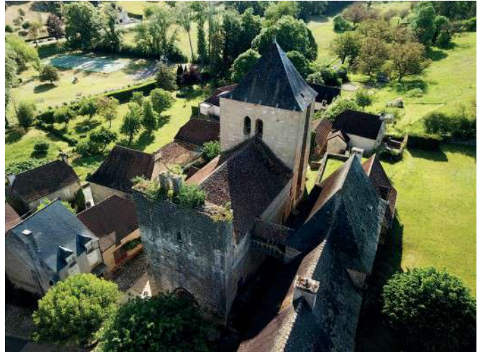
Auriac Eglise

L'église de style roman aurait pris la place d'un édifice antérieur. A l'origine elle devait avoir 2 coupes, dont on devine encore les bases. La présence des Chevaliers du Temple se manifeste par le renforcement du système de défense de l'édifice.