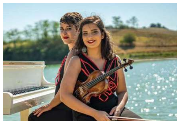
Duo MiraLamar

Voyage à travers l'héritage des villes palestiniennes.