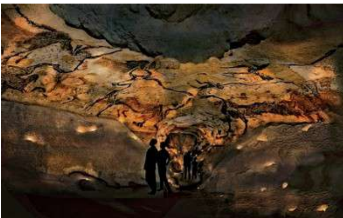
Lascaux CIAP

« Chapelle Sixtine de la préhistoire » âgée de près de 20 000 ans, Lascaux est la grotte ornée la plus célèbre du monde. Depuis sa fermeture au public, les visiteurs se pressent pour visiter les fac-similés successifs - dernier en date, le Centre International de l'Art Pariétal Lascaux IV inauguré en 2017, Il donne ainsi accès à l'intégralité des parois ornées de la grotte et facilite la compréhension de cet art premier grâce à des dispositifs numériques inédits.