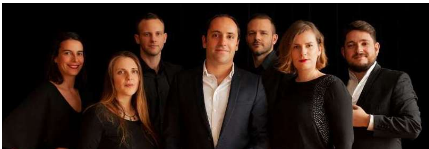
Les surprises