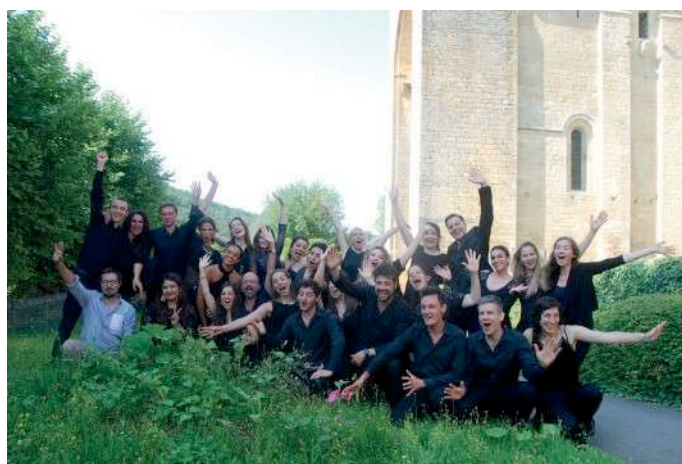
Académie baroque internationale 2021